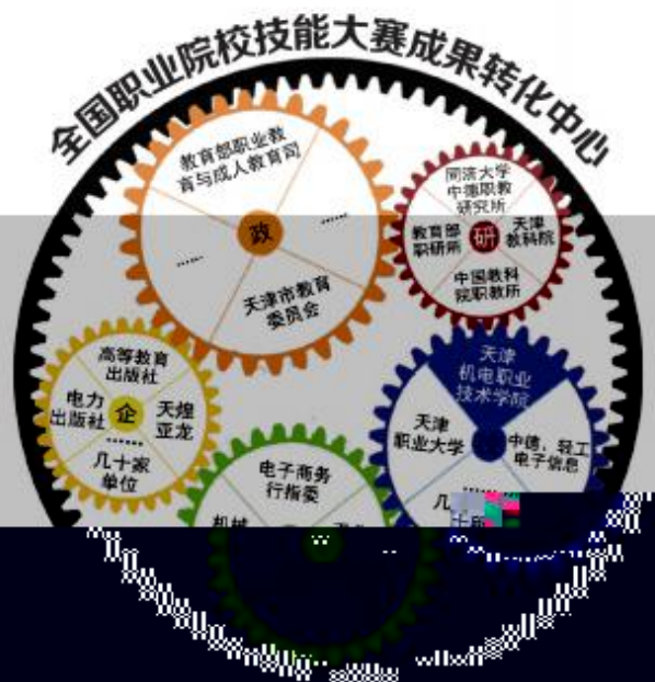
图 1 中心职能

整、“双师型”教师和综合实训基地建设导向分析;建立课程、培养规格与职业标准高效对接机制,研制开发技能大赛教学资源平台和教学仪器设备,引领和服务日常教学;创新技能人才培养选拔与教师的综合评价机制,探索学生综合职业能力培养模式;研究国赛与世界技能大赛的对接机制,引导现代教学组织方式、教学方法的广泛应用;充分发挥大赛博物馆的作用,加快大赛成果的转化,不断提高全国职业院校技能大赛的受益面。